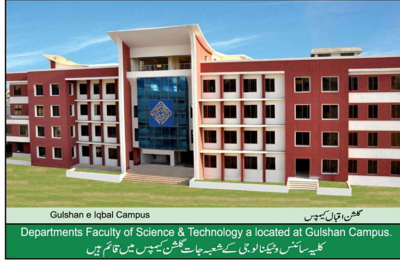
Gulshan e Iqbal Campus گلشن اقبال کیپس Departments Faculty of Science & Technology a located at Gulshan Campus. کلیہ سائنس و ٹیکنالوجی کے شعبہ جات گلشن کیپس میں قائم ہیں

Federal Government Urdu Science College was established in 1964. All subjects of Science at the level of undergraduate to graduate were taught through urdu medium. During 2002 the college gains the status as Federal Urdu University for Arts, Sciences and Technology. Faculty of Science of FUUAST offer all subjects of science and natural science study up to higher level to change your future and around. The students and faculty interaction of university, provide a unique and intellectual environment to ensure to excellent post-graduate and research program to produce excellent output to enhance quality of education. It is undeniable fact that science has led us to find out thing that give us what we have today. Faculty of Science is very much aware of this fact that we need to equip to accept the new challenges and they are well aware how to go forward. Subjects: Biochemistry, Biotechnology, Botany, Chemistry, Computer Science, Environmental Science, Geography, Geology, Mathematical Science, Microbiology, Physics, Sports Science, Statistics and Zoology.