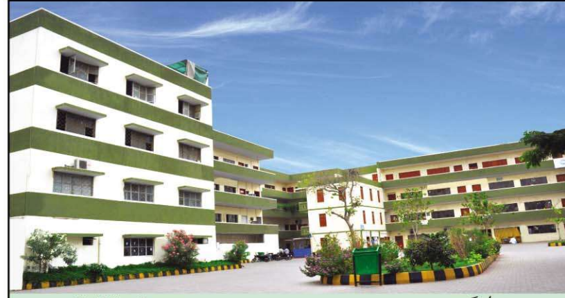
Abdul Haq Campus

Faculty of Education in one of the important and dynamic faculty of Federal Urdu University of Arts, Science and Technology it was established in 2014 with three departments; Education, Special Education and Teacher Education. Its aims to developed such an Educational leadership that contribute their potential at national and international level and also play a vital role in human development and research as well as the promotion of Globalization. The department under faculty of education had been established since the establishment of Federal Urdu University. All the departments offer programs ranging from BS (Bachelor of Study) to Ph.D (Doctor of Philosophy) under the guidance and supervision of highly competent and renewed faculty in the field of Education. Faculty of Education Provides necessary academic environment, seminar library and Education Technology resources to their students. As, Education is one of the important discipline of 21st century. Its dynamic nature and progress increases its demand in this era of Science of Technology, and Globalization, that's why the faculty of education and its constituent departments continue strives for the quality of education and the best Facilities.